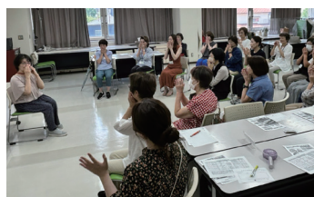
第1回は手遊びや読み聞かせも実施