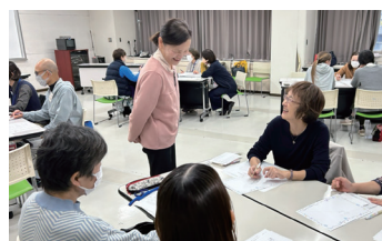
第2回はワークを通して言葉の受け取り方の違いを体験